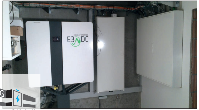
Verband EnergieErzeugende Gebäude e.V.